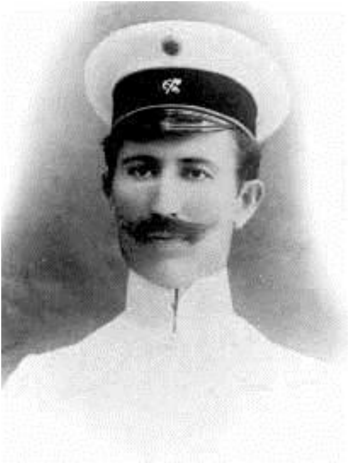
Махач Дахадаев (1882-1918) Один из организаторов борьбы за Советскую власть в Дагестане. Член Областного военно-революционного комитета.