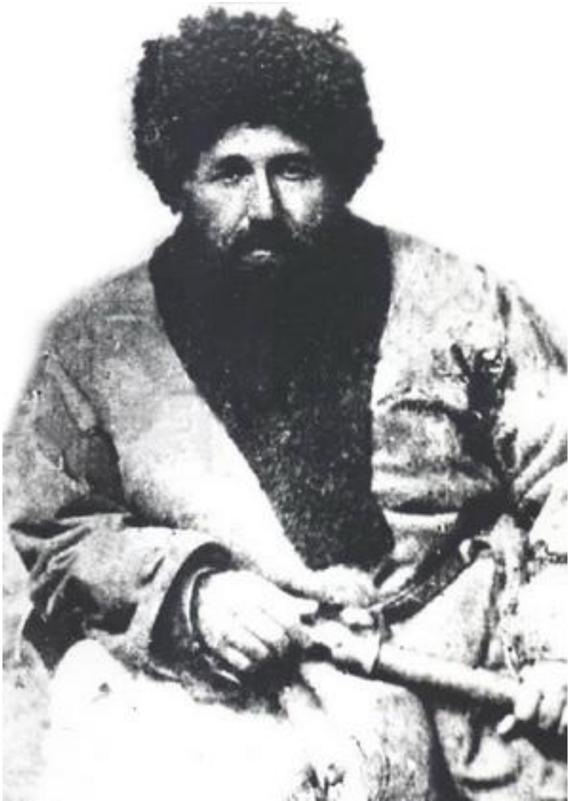
Гоцинский Нажмутдин (1859-1925) Лидер клерикально-феодалных сил, боровшийся против Советской власти в Дагестане, муфтий.