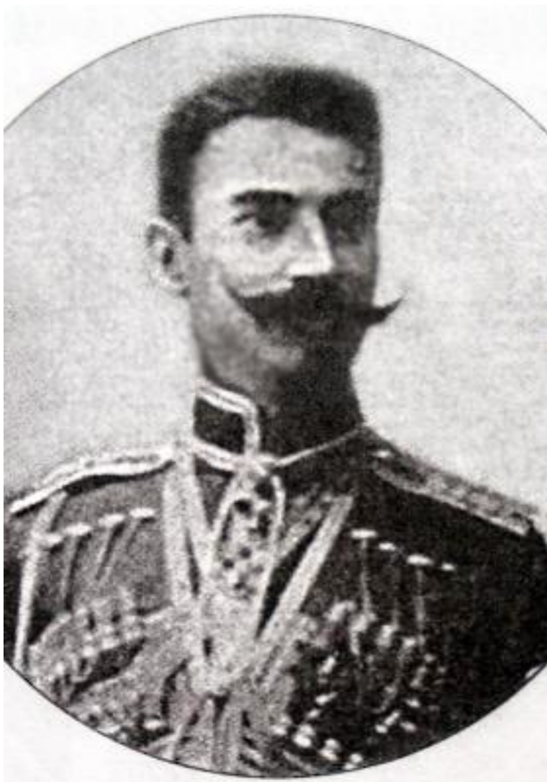
Арацханов Хаджи-Мурад (1880-????) Полковник царской армии, сторонник Н. Гоцинского.