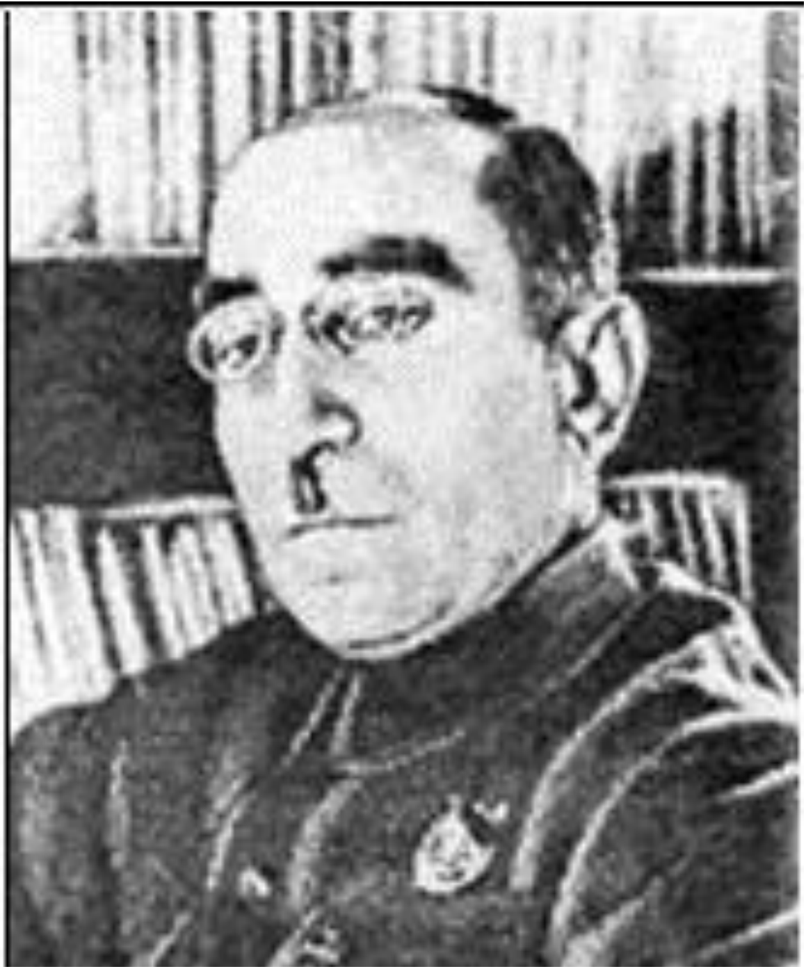
Магомед Далгат (1893-1942) Активный борец за власть Советов в Дагестане. Председатель ДагЦИКа, секретарь Даг обкома РКП(б).