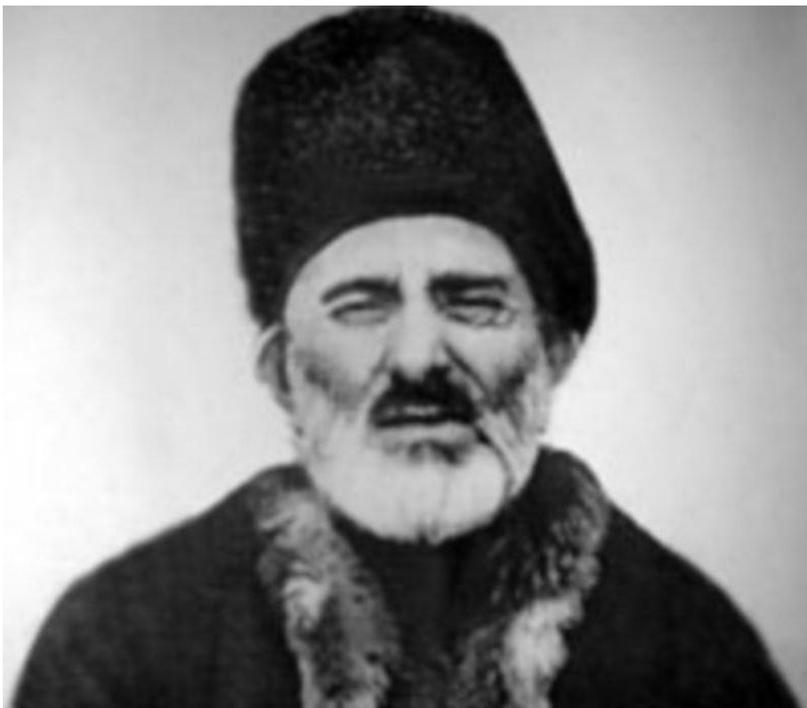
Узун-Хаджи Салтинский (1848-1920) Религиозный и политический лидер контрреволюции в Дагестане, создатель Северо-Кавказского эмирства, шейх.