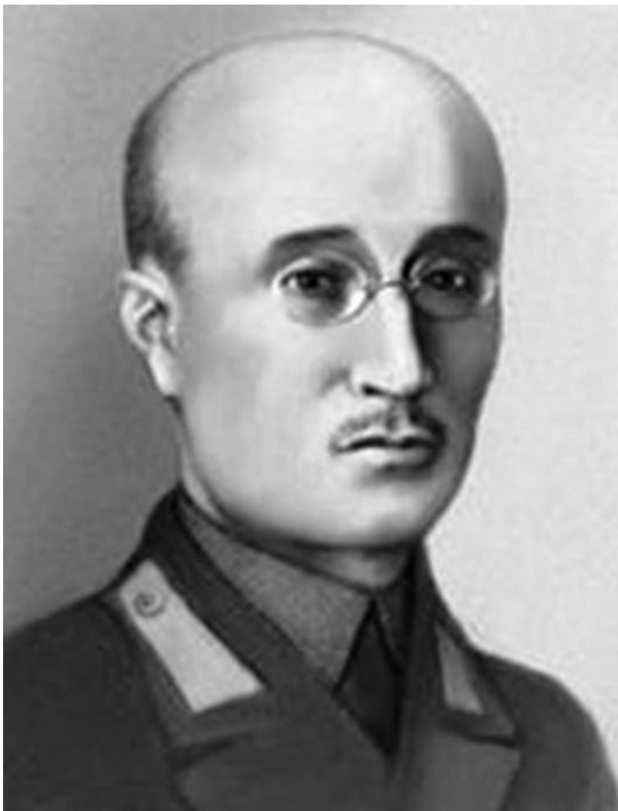
Буйнакский Уллубий (1890-1919) Лидер борьбы за Советскую власть в Дагестане и на Северном Кавказе. Председатель Дагестанского обкома РКП(б)