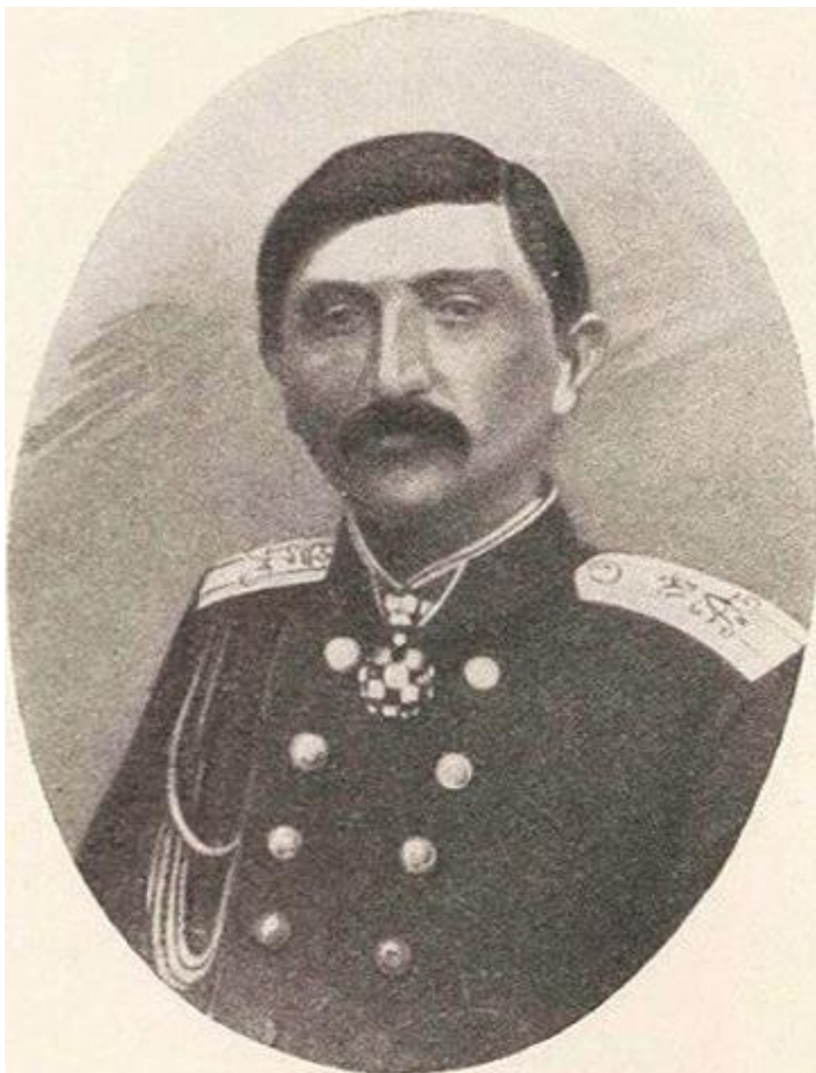
Ибрагим-хан Мехтулинский Царский офицер, активный участник борьбы против установления Советской власти в Дагестане.