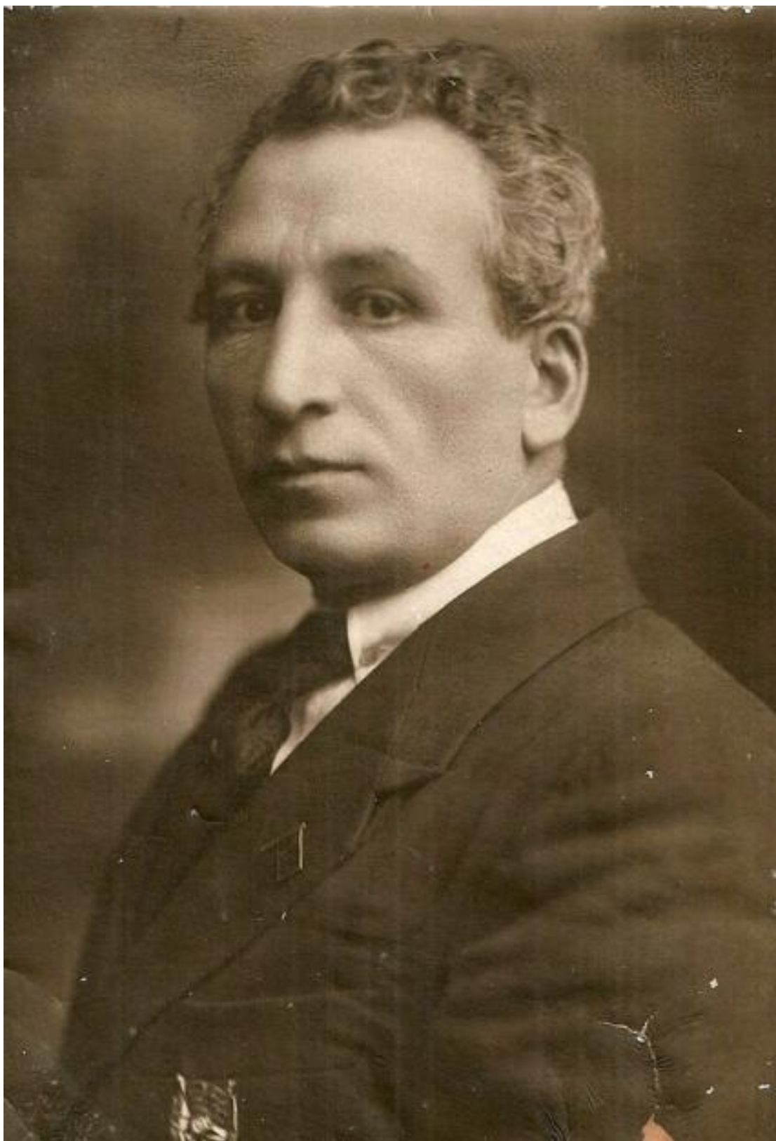
Джалалутдин Коркмасов (1877-1938) Один из руководителей борьбы за установление Советской власти в Дагестане. Председатель Совнаркома ДАССР.